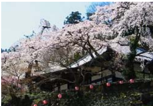
兵庫県神戸市北区有馬町

樹齡 250 年を超えると言われる 4 本のしだれ桜は糸桜と呼ばれ、桜を愛した太閤秀吉は千利休とともに度々茶会を開き、秀吉が千利休に命じて作らせたという茶釜（阿弥陀堂釜）も残されています。当時のご本尊は阿弥陀三尊仏で天竺伝来と伝えられ多田源氏の祖、満仲の守り仏であったと言われています。また、国の重要文化財に指定された聖徳太子立像も安置されています。