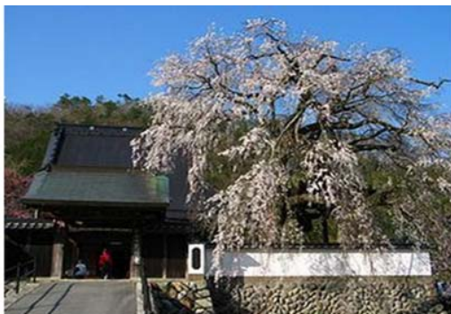
兵庫県佐用郡佐用町漆野

佐用町（旧 南光町）光福寺の枝垂れ桜は播州播磨地方随一といわれるイトザクラです。このイトザクラ（しだれ桜）は根回り 8メートル、高さ 13メートル。イトザクラとしては珍しい樹齢 300 年をこえる老木で、1984 年（昭和 59 年）には、県指定天然記念物にも指定されています。