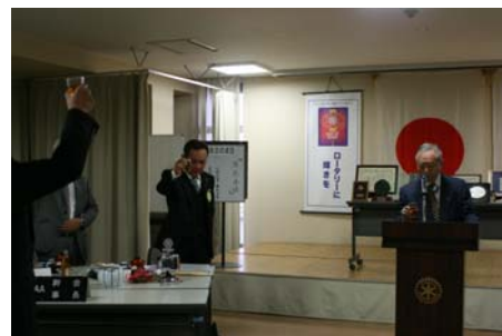
大川会員による新年にちなんで一言、そして乾杯！