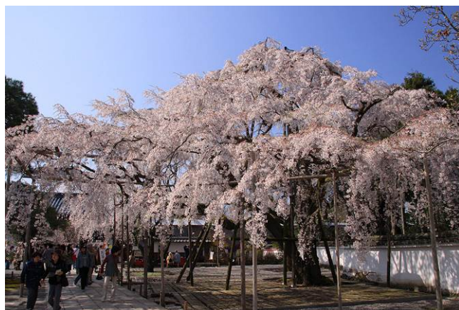
京都府伏見区 醍醐寺

三宝院の大玄関前に咲く枝垂れ桜は、訪れる人を歓迎するかのように大きく枝を伸ばして咲いています。