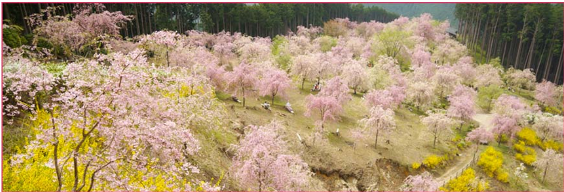
奈良県東吉野村杉谷

1000本のしだれ桜と山々の絶景を楽しめる「天空の庭 高見の郷」は、吉野の山に匹敵するようにと、大自然の中にしだれ桜の庭園を作りたいという思いから誕生いたしました。杉檜を育てるにも百年近くかかる中、他では類を見ない数のしだれ桜の育成にじっくりと取り組んでいます。年々その姿を変え、美しく成長していく人工林としだれ桜を、一度お尋ねください。