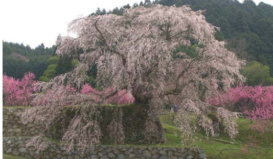
奈良県宇陀市大宇陀本郷

又兵衛桜（またべえざくら）は、奈良県宇陀市大宇陀本郷（旧大宇陀町域）にある、樹齢300年とも言われる桜の古木。瀧桜（たきざくら）とも呼ばれる。県の保護樹。2000年のNHK大河ドラマ『葵徳川三代』のオープニング映像で使用された事で有名になった