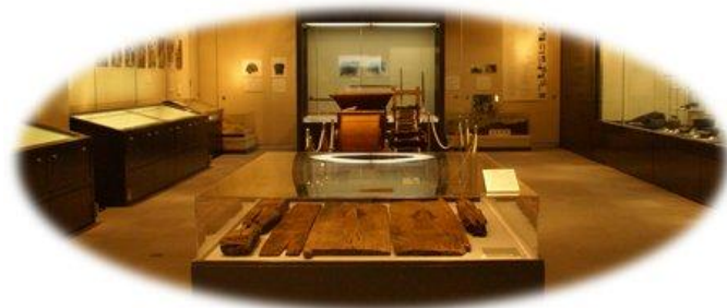
大東市立歴史民族資料館