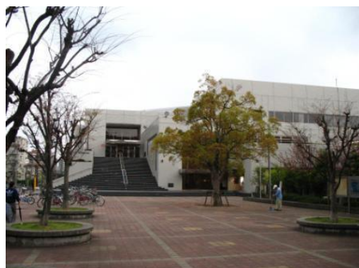
大東市立中央図書館