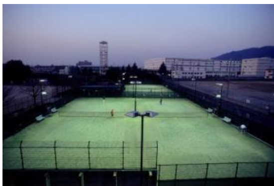
大東市立テニスコート