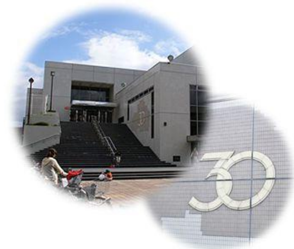
大東市立文化センター サーティホール

大東市を「文化とスポーツの盛んなまち」と自信を持って言える、そんなまちにしたいと考えています。